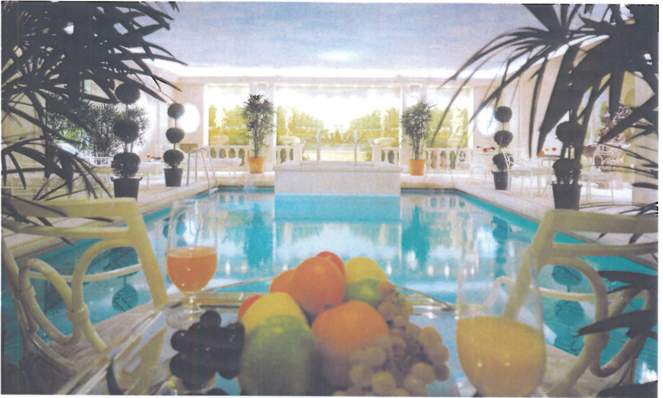
Une œuvre magistrale : le «George V» à Paris : très célèbre Palace près des Champs-Élysées