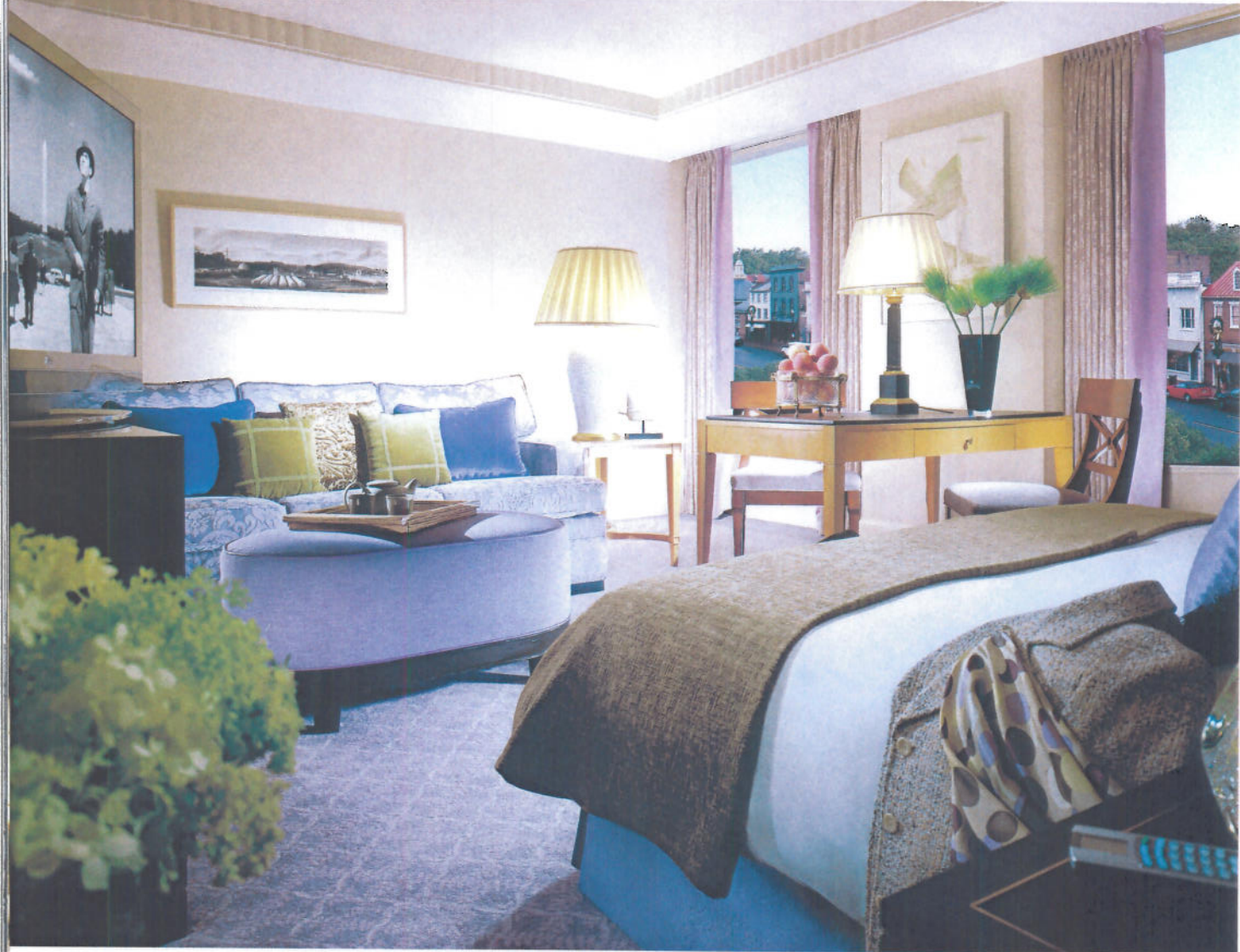
Pierre Yves Rochon œuvre régulièrement pour les hôtels «Four Seasons». Ici, celui de Washington, DC ...