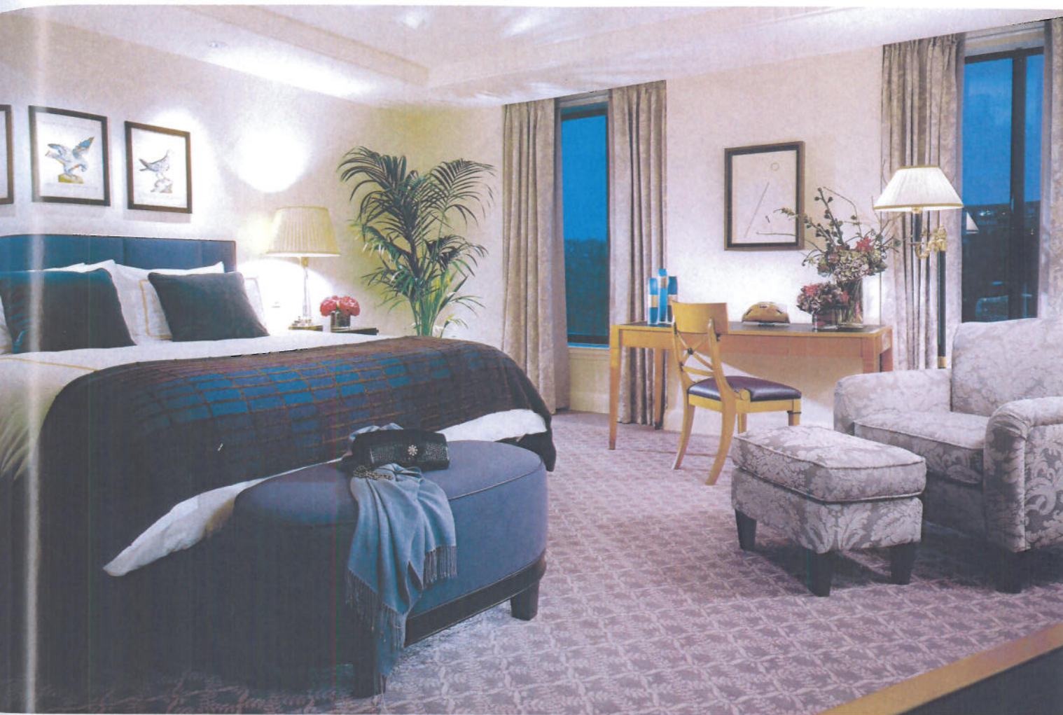
... avec ses luxueuses suites, son restaurant ...

groupes me sollicitent pour réaliser leurs divers projets. Je pense avant tout qu'en faisant appel à moi ces leaders de l'hôtellerie internationale recherchent le professionnalisme de mon bureau, le sérieux et la rigueur avec lesquels nous traitons chacun de nos projets, l'éternelle curiosité de toujours faire des choses différentes, sans oublier que je reste très impliqué personnellement dans la création.